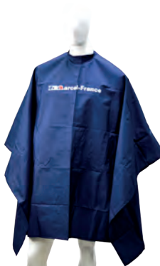
CAPA IMPRESA 140 X 145 AZUL

Capa para peluquería bordada en material antifluído tiene un acabado protector que repele líquidos y salpicaduras accidentales, su fabricación y material son de excelente calidad, el cierre del cuello con cordón permite que se ajuste a cualquier tamaño.