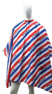
CAPA RAYADA BANDERA FRANCIA

Capa para peluquería estampada en screen de material antifluído tiene un acabado protector que repele líquidos y salpicaduras accidentales, su fabricación y material son de excelente calidad, el cierre del cuello con cordón permite que se ajuste a cualquier tamaño.