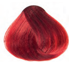
COLOR SPLENDOR ROJO

Coloración directa y semipermanente sin oxidación al cabello.