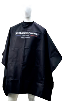
CAPA IMPRESA 140 X 145 NEGRA

Capa para peluquería bordada en material antifluído tiene un acabado protector que repele líquidos y salpicaduras accidentales, su fabricación y material son de excelente calidad, el cierre del cuello con cordón permite que se ajuste a cualquier tamaño.