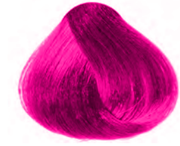
COLOR SPLENDOR FUCSIA

Coloración directa y semipermanente sin oxidación al cabello.