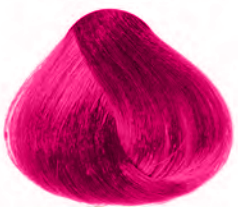
COLOR SPLENDOR MAGENTA

Coloración directa y semipermanente sin oxidación al cabello.