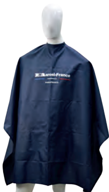
CAPA BORDADA 140 X 145 AZUL

Capa para peluquería en tela impresa de material antifluído tiene un acabado protector que repele líquidos y salpicaduras accidentales, su fabricación y material son de excelente calidad, el cierre del cuello con cordón permite que se ajuste a cualquier tamaño.