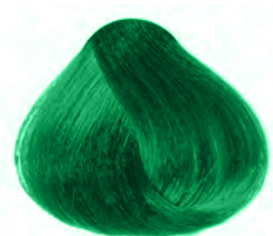
COLOR SPLENDOR VERDE

Coloración directa y semipermanente sin oxidación al cabello.