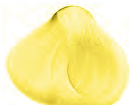
COLOR SPLENDOR AMARILLO

Coloración directa y semipermanente sin oxidación al cabello.