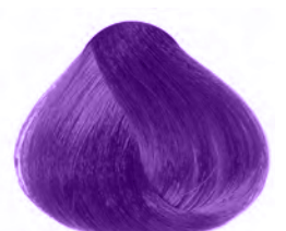
COLOR SPLENDOR VIOLETA

Coloración directa y semipermanente sin oxidación al cabello.