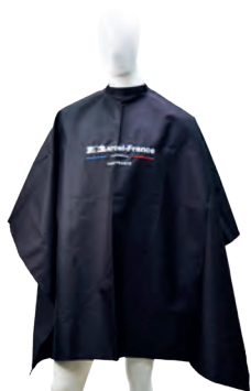
CAPA BORDADA 140 X 145 NEGRA

Capas, insumos, accesorios , instrumentos y mobiliario de uso profesional