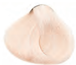
COLOR SPLENDOR NEUTRO

Coloración directa y semipermanente sin oxidación al cabello.